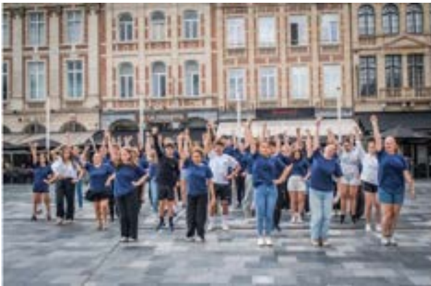
Flashmob te Brussel tijdens jongerenuitwisseling LgrL juli 2024

Sinds 1982 vindt er jaarlijks een jongerenuitwisseling plaats. Deelnemers zijn jongeren uit de 6 gemeenten tussen de 15 en 20 jaar; doorgaans wordt de jeugduitwisseling financieel ondersteund via het EU-programma Erasmus+.