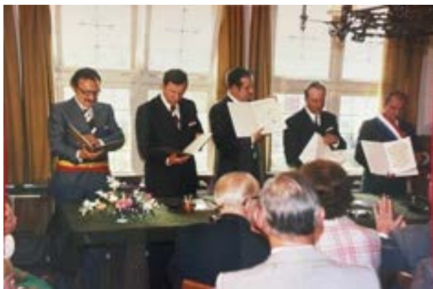
Ondertekening vriendschapsband op 21 juni 1974 gemeentehuis Beers.

De contacten groeiden uit tot een officiële vriendschapsband tussen de vijf gemeenten, welke op 21 juni 1974 ondertekend werd in het gemeentehuis van Beers (NL).